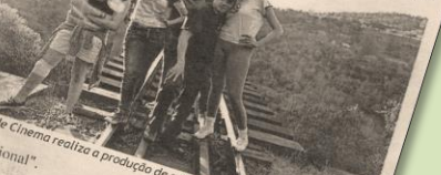
Núcleo de Cinema realiza a produção de seu primeiro curta-metragem e educacional.

Na noite de segunda-feira a avenida Silvio Sanson foi interrompida por cerca de três horas pelo curta-metragem "Sua vida, nossa vida". A equipe do Núcleo de Cinema de Guaporé finalizou a produção de um material educativo e cultural, de, em sua maioria, jovens estudantes.