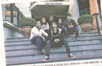
Talentes locais trabalham na frente e atrás das câmeras e irão abordar a temática do combate ao uso de drogas

Conheça a Artmanhas em: artmanhascineatral.blogspot.com