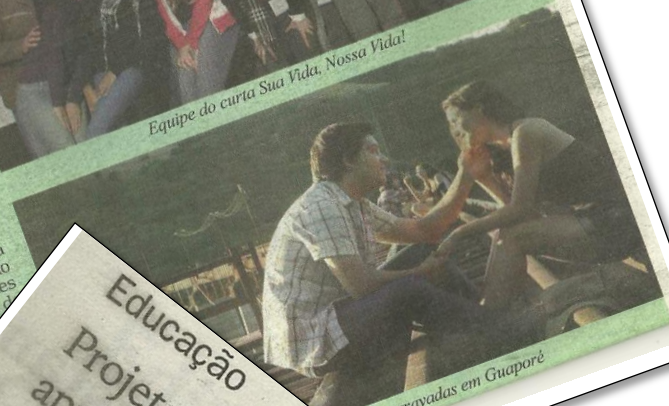
Foram gravadas em Guaporé