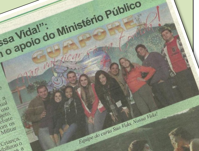
Equipe do curta Sua Vida, Nossa Vida!

"Sua Vida, Nossa Vida! Nossas Vidas" foi dirigido por Mano Ricardo Fagundes e tem no elenco estudantes de ensino de Guaporé. O roteiro mostra a íntima relação de drogas e a criminalidade, além de abordar temas amorosos.