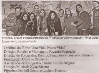
Créditos do Filme "Sua Vida, Nossa Vida!"

O curta-metragem "Sua Vida, Nossa Vida!", produzido na cidade de Guaporé pelo Núcleo de Cinema, em parceria com Art'Manhas Cia Teatral, está próximo de ser lançado oficialmente à comunidade. Sob direção e roteiro de Ricardo Fagundes, o filme educativo e cultural conta com elenco de jovens guaporenses que abordam abertamente, durante o desenrolar da história, conflitos reais do dia a dia dos jovens, trazendo à tona aspectos que o adolescente vivencia, mas não percebe ou não quer ver, através de uma das mais ricas atividades artísticas da atualidade, o cinema.