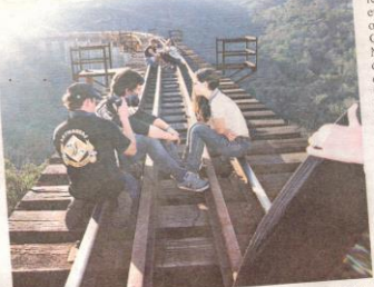
Núcleo de Cinema de Guaporé tem sua sede na Casa da Cultura, e realiza a produção de seu primeiro curta-metragem