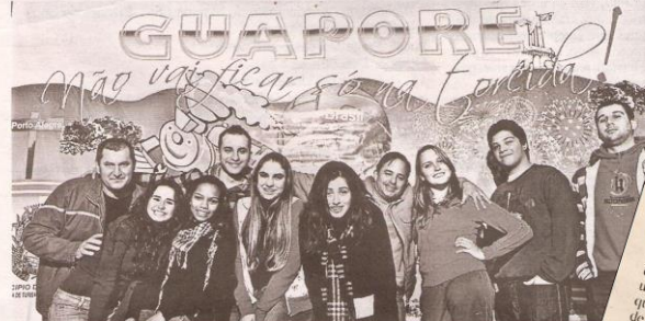
Curta-metragem foi produzido em Guaporé, com atores e técnicos locais, que surpreendem pelo talento e profissionalismo

Talento e qualidade comprovam competência da equipe