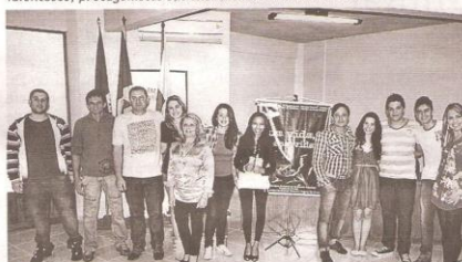
Equipe envolvida na produção do filme