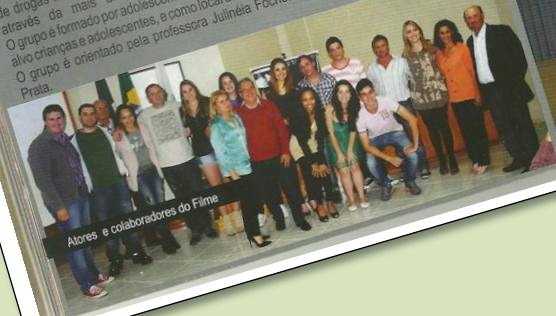
Atores e colaboradores do Filme