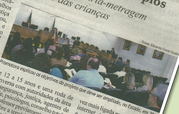
Promotora explicou os objetivos do projeto que deve ser ampliado, no Estado, em 2014