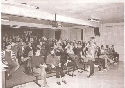
Plateia contou com autoridades e pessoas que serão responsáveis pela disseminação do curta pela sociedade

Após o lançamento, o filme será exibido em todas as cidades da serra gaúcha.